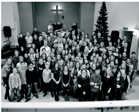
En bild från Prismas julfest den 19 december.